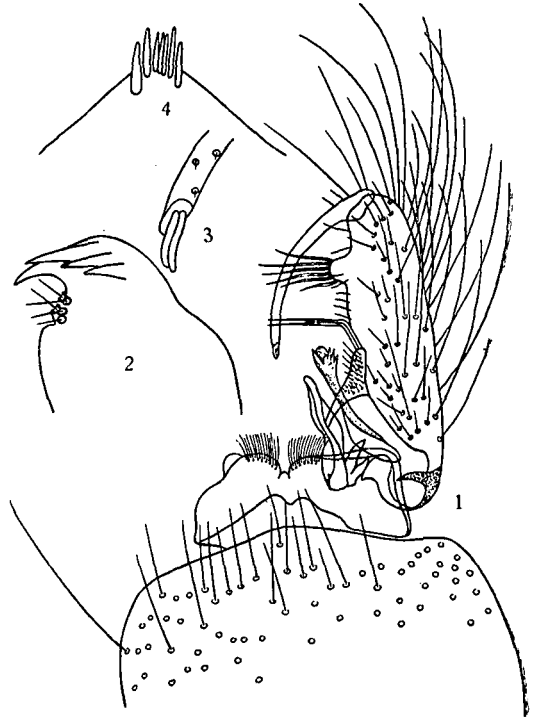
图1 1—3. 中华赛氏蚊的雄蚊尾器: 1. 尾器全形。2. 肛侧板末端放大, 侧面观。3. 指节与爪放大。4. 银带赛氏蚊第八腹节背板, 表示其后缘有一羣粗大的刺状毛(由 Штакельберг 1937 仿 Barraud) 以与中华赛氏蚊作比较。

腹部 第8节两侧各约有四十多个至五十个櫛齿。每个櫛齿末端圆，侧部及端部均有缝，两侧的缝较粗，末端的缝较细。五毛中的背毛分2—4芒状甚少为简单的支，中毛分7—11芒状支，腹毛分3—4芒状支。呼吸管指数大于2，基部有袋状突，基部腹面的骨质外皮缺如成一深凹陷，在凹陷后缘的两侧着生一对约有7个芒状分支的呼吸管毛。呼吸管梳齿列占管基部的3/4，基段的齿正常，末段的齿成长毛状。正常的齿列于气管基部1/3，约有11—20个，一般13—17个，其基端的齿小，愈向末端齿越长，每齿有2—3个侧